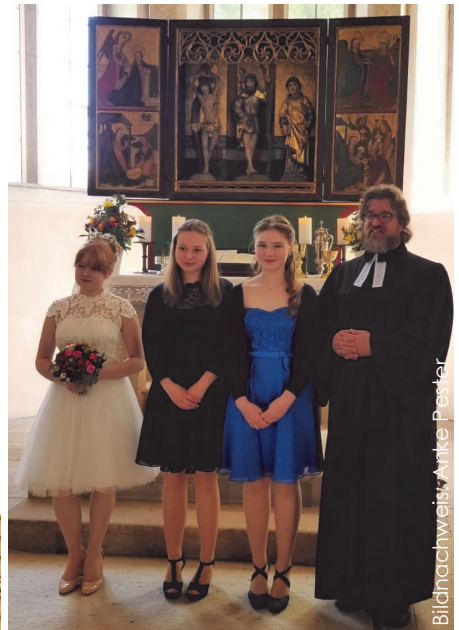
Bildnachweis: Anke Pester

Herzlichen Dank allen Konfirmanden und ihren Familien für Ihre Konfirmandengabe von 70€.